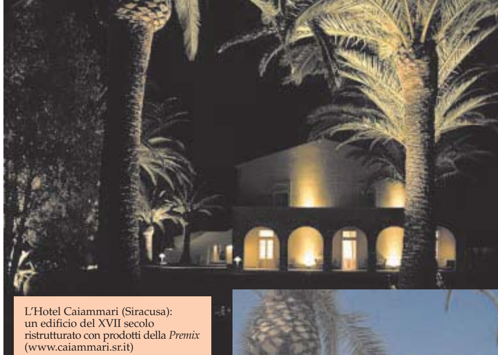
L'Hotel Caiammari (Siracusa): un edificio del XVII secolo ristrutturato con prodotti della Premix ( www.caiammari.sr.it )

La gamma dei prodotti Premix comprende malte normali