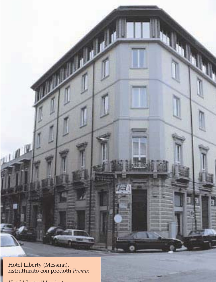
Hotel Liberty (Messina), ristrutturato con prodotti Premix