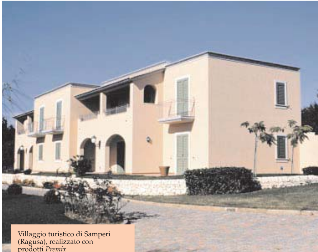
Villaggio turistico di Samperi (Ragusa), realizzato con prodotti Premix

Today, the construction market has undergone significant changes that have forced the